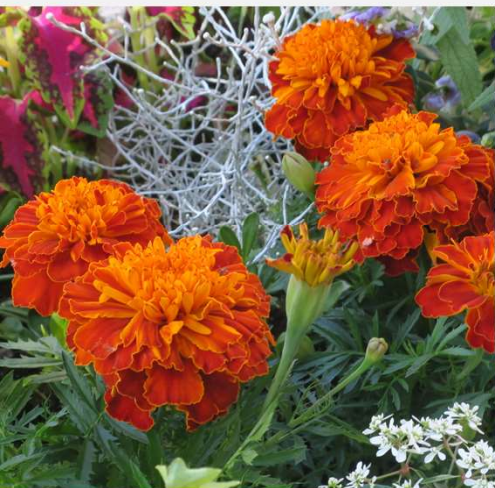
マリーゴールド 尾張