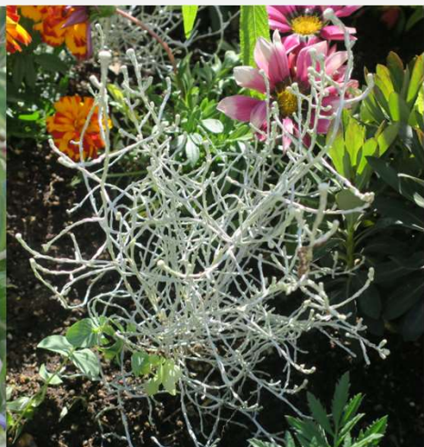
カロケファルス 稲沢市