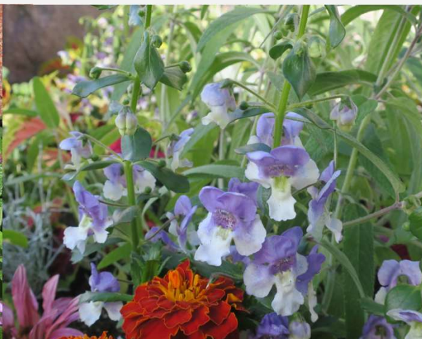
アンゲロニア 稲沢市